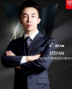
STEFAN K-BEAUTY美林匹克大赛承办方