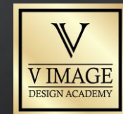
브이 이미지 아카데미 V IMAGE DESIGN ACADEMY (Malaysia / Guangzhou / Shenzhen / Indonesia )