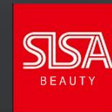
시사코스메틱 SISA COSMETIC