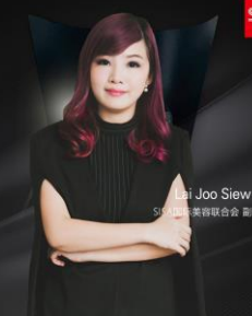
鹿兰社 SISA国际美容联合会 副会长