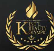
케이뷰티올림픽 K-BEAUTY OLYMPIC