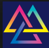
케이뷰티올림픽 태국 K-BEAUTY OLYMPIC (Beyond Infinite)