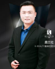
鹿兰社 K-BEAUTY美林匹克大赛承办方