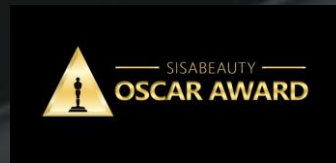
시사 오스카어워드 SISA OSCAR AWARD