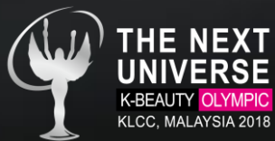
케이뷰티올림픽 말레이시아 K-BEAUTY OLYMPIC (The Next Universe)